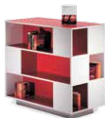
Étagères à livres

Tous les Labyrinth sont avec socle ou 4 roulettes, dont 2 avec frein.